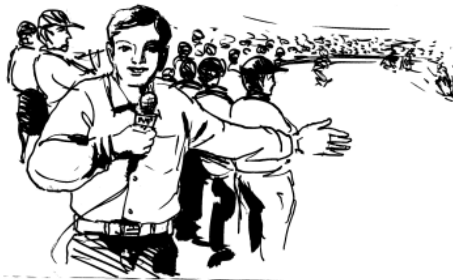
चित्र 24.1 : एक क्रिकेट मैच की रिपोर्टिंग

जो लोग प्रिंट मीडिया में काम कर चुके हैं, वे किसी भी मीडिया संगठन के न्यू मीडिया डीविजन में काम कर सकते हैं। दरअसल डीविजन हमेशा अच्छे संवाददाता, संपादक एवं लेखकों के खोज में रहते हैं। न्यू मीडिया के संवाददाता न केवल अच्छे, नये समाचार सीखते हैं वरन उन समाचारों का भी अनुसरण करते हैं जो पहले प्रिंट प्रकाशन में छप गया हो।