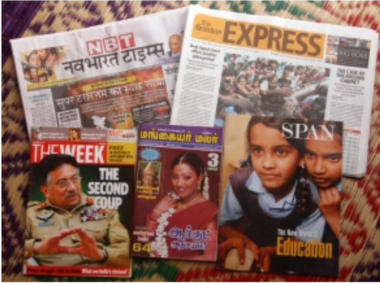
चित्र 2.4: मुद्रित माध्यम

जिस मुद्रण प्रक्रिया का विकास गुटेनबर्ग ने किया था वह बाद में और अधिक परिवर्तित तथा यंत्र पर निर्भर बनी। आज मुद्रण अत्यधिक परिष्कृत हो गया है और मुद्रित माध्यम यथा समाचारपत्र, साप्ताहिक और मासिक पत्रिकाएँ अपने आधुनिक मुद्रण प्रेस का उपयोग करते हैं, जो अत्यधिक तीव्र गति से छपाई करने में सक्षम हैं। कम्प्यूटर की वजह से मुद्रण प्रक्रिया और भी सुधर गयी है। आप 'मुद्रण माध्यम' के बारे में अगले पाठ में मुद्रण के विषय में और अधिक जानकारी प्राप्त करेंगे।