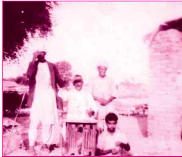
(हेमूं कालाणीअ जो पिता श्री पेसूमल सिरुनि जे भटे ते)