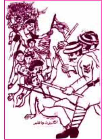
(अंग्रेज़नि जा जुल्म)

माहोल नाटक जो अहमियत भरियो तत्व आहे। हिन खे ज़मान, मकान ऐं माहोल बि सडियो वेंदो आहे। “अमां मां मोटी ईंदुसि” नाटक पढण सां दृश्यनि ऐं किरदारनि जी गुप्तगूअ मां इहा ज़ाण मिले थी त नाटक जो माहोल अंग्रेज़नि जे राज़ सता सां गडु सिंधु ऐं भारत में आज़ादीअ जे हलचल वारो हो ऐं देशप्रेम, भारत जे हरहिक नागरिक में कूट कूट भरियल हो। अंग्रेज़नि जे जुल्म खां भारतवासी तंग हुआ।