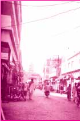
(पुराणो सखर शहर- हेमूं कालाणीअ जो जनम स्थान)

अजाब = कष्ट, तकलीफूं इंकिलाबु = फेरो, तब्दील सपूतु = पुटु, औलाद मुकमिलु = पूर्ण संगीनु = भारी, ग़ौरो जुर्मु = डोहु, गुनाहु सुहागिणि = जंहिंजो पति हयात हुजे डुहागिणि = जंहिंजो पति मरी वियो हुजे