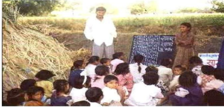
गन्ना फार्मों पर साखर शालाएँ