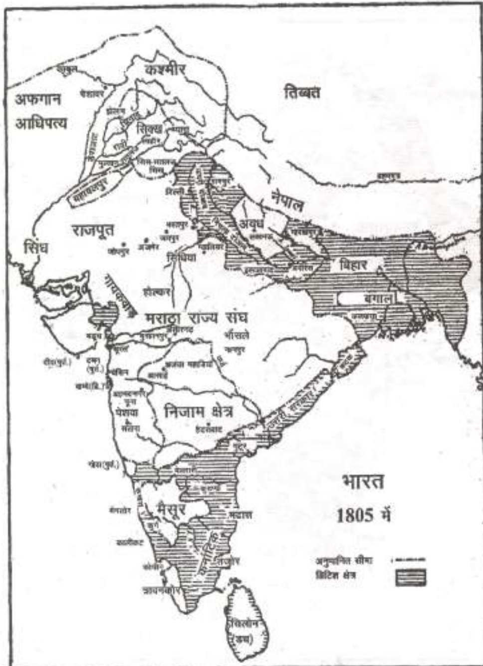
मानचित्र 16.2 भारत 1797-1805

गोद लेने का चलन था। (दत्तक पुत्र गोद लेने का चलन था।) किन्तु राज्य विलेय नीति के तहत कोई भी भारतीय राज्य जो या तो अंग्रेजी राज्य के अधीन था या उसके द्वारा ब्रिटिश अधिनिस्थ प्रणाली के सहायक राज्य के रूप में निर्मित थे, वे शासक के अक्षम होने की स्थिति या उसके पुत्र न होने की स्थिति में ब्रिटिश राज्य के अधीन हो जाएंगे। इस प्रकार भारतीयों द्वारा उत्तराधिकारी न होने की स्थिति में उत्तराधिकारी धयन करने की सर्वोच्चता को ही समाप्त नहीं किया बल्कि अंग्रेजों ने भारतीय शासकों की क्षमताओं को आँकने का भी अधिकार हासिल कर लिया।