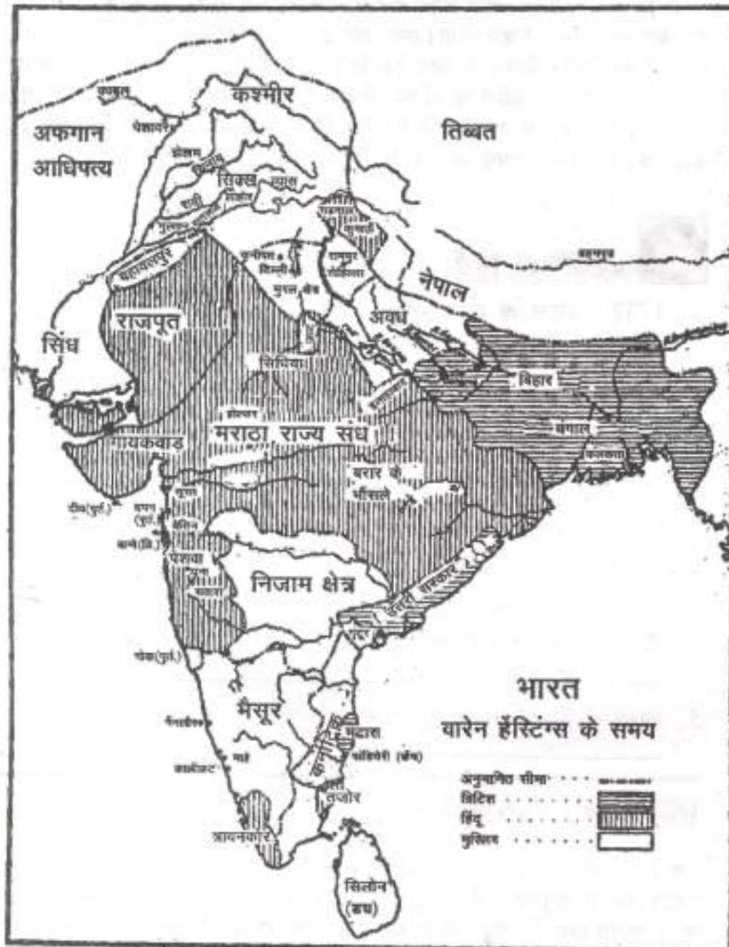
मानचित्र 16.1 भारत 1783 में