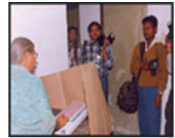
चित्र 22.5 एक मतदान केन्द्र में चुनाव का चित्र