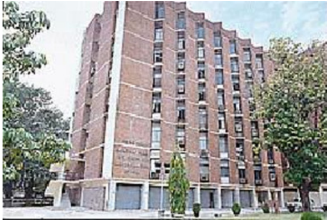
चित्र 22.4 भारत के निर्वाचन आयोग का मुख्यालय

भारत में स्वतंत्र और निष्पक्ष चुनाव कराने का कार्य एक निष्पक्ष संवैधानिक सत्ता को दिया गया है जिसे निर्वाचन/चुनाव आयोग कहा जाता है। निर्वाचन आयोग एक कानूनी नहीं बल्कि एक संवैधानिक संस्था है। संसद या राज्य विधानमंडल द्वारा बनायी गयी संस्था को कानूनी संस्था कहा जाता है जबकि एक संवैधानिक संस्था को शक्ति स्वयं संविधान द्वारा प्रदान की जाती है। हमारा संविधान चुनाव/निर्वाचन आयोग की व्यवस्था करता है। चुनाव आयोग का गठन एक मुख्य चुनाव आयुक्त तथा कुछ अन्य चुनाव आयुक्तों से मिलकर होता है। वर्तमान समय में चुनाव आयोग में एक मुख्य चुनाव आयुक्त और दो चुनाव आयुक्त होते हैं।