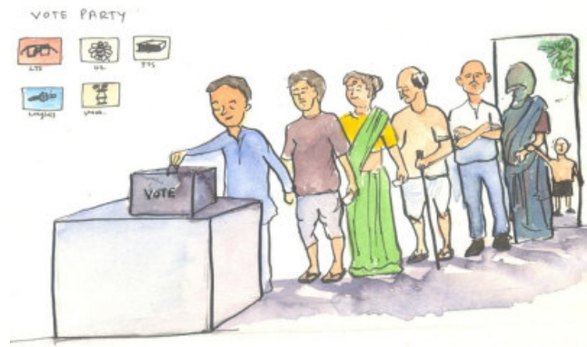
चित्र 22.3 एक मतदान केन्द्र पर कतार में खड़े मतदाता

पूरे देश, राज्य या स्थानीय निकाय को कई चुनाव क्षेत्रों में बांट दिया जाता है। प्रत्येक चुनाव क्षेत्र या निर्वाचन क्षेत्र से कई उम्मीदवार चुनाव लड़ते हैं। निर्वाचन क्षेत्र में जो उम्मीदवार अन्य की तुलना में अधिक मत प्राप्त करता है उसे निर्वाचित घोषित कर दिया जाता है।