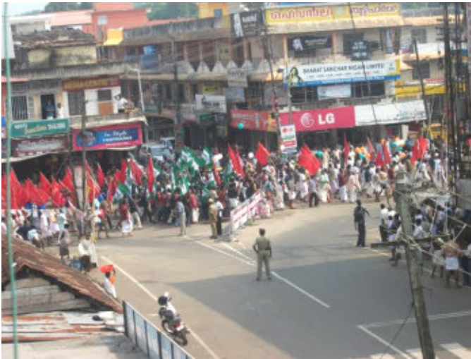
चित्र 22.1 एक चुनाव रैली में जन सहभागिता

आपने लोगों को चुनाव में मतदान करते देखा होगा। क्या आपने किसी चुनाव में मतदान किया? हम अपने प्रतिनिधियों का चुनाव करने के लिये मतदान करते हैं। ये प्रतिनिधि आगे चलकर सरकार का निर्माण कर शासन चलाते हैं। सरकार बनाकर ये जन प्रतिनिधि सरकार की नीतियों और कार्यक्रमों को क्रियान्वित करते हैं। चुनाव में लोगों की भागीदारी से ही हमारा लोकतंत्र एक प्रतिनिध्यात्मक और सहभागी लोकतंत्र बनता है, लेकिन जन सहभागिता का आरम्भ और अंत केवल चुनाव में मतदान करने से नहीं होता। जन सहभागिता अन्य अनेक तरीकों जैसे सार्वजनिक बहस, समाचार पत्रों के सम्पादकीय, विरोध प्रदर्शन तथा सरकार के कार्यक्रमों में सक्रिय भागीदारी आदि द्वारा भी व्यक्त होती है। चुनाव प्रक्रिया में भी सहभागिता, राजनीतिक चर्चा, राजनीतिक दलों के लिये कार्य करना, चुनाव में प्रत्याशी के रूप में खड़ा होने जैसे कई तरीकों से देखने से मिलती है।