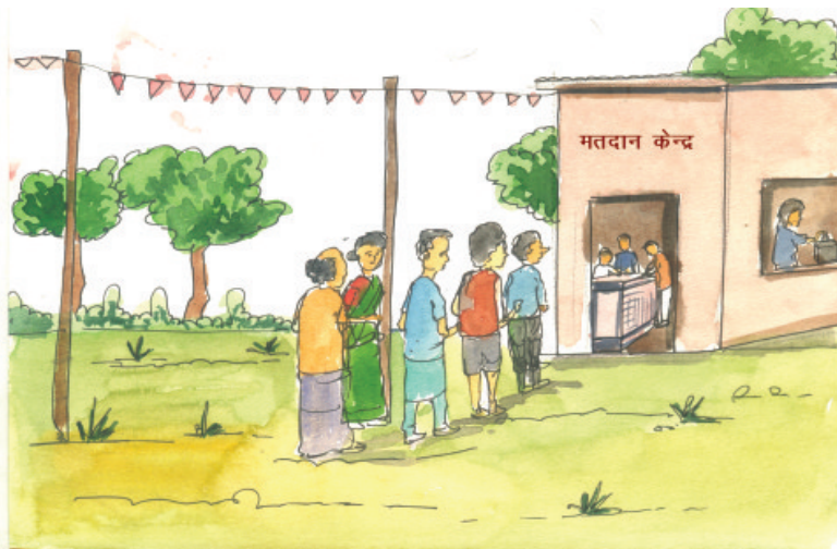
चित्र 22.7 स्वतंत्र एवं निष्पक्ष चुनाव

वास्तव में लंबी अवधि से चुनाव सुधारों ने संसद, सरकार, आयोग, प्रैस तथा लोगों का ध्यान आकर्षित किया है। अतीत में कानून की स्पष्ट खामियों को दूर करने के लिए कुछ कदम उठाए गए हैं। निकट अतीत के अनुभवों के आधार पर कानून के कुछ प्रावधानों में संशोधन के लिए शीघ्रता से कुछ कदम उठाने की आवश्यकता का अनुभव किया गया है। कुछ ऐसे मुद्दे हैं जिन पर तत्काल ध्यान देने की जरूरत है जैसे (क) चुनावों में हेराफेरी, नकली और फर्जी मतदान, प्रतिरूपण (ख) चुनाव के दौरान हिंसा (ग) धन और बाहुबल की प्रतिकूल भूमिका (घ) मतदाताओं, विशेषकर कमजोर वर्ग के लोगों को डराना, धमकाना (ङ) सरकारी तंत्र का दुरुपयोग (च) मतदान केन्द्र पर कब्जा तथा चुनाव व राजनीति का अपराधीकरण।