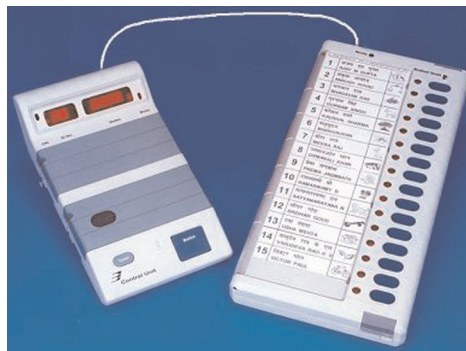
22.6 इलेक्ट्रॉनिक वोटिंग मशीन