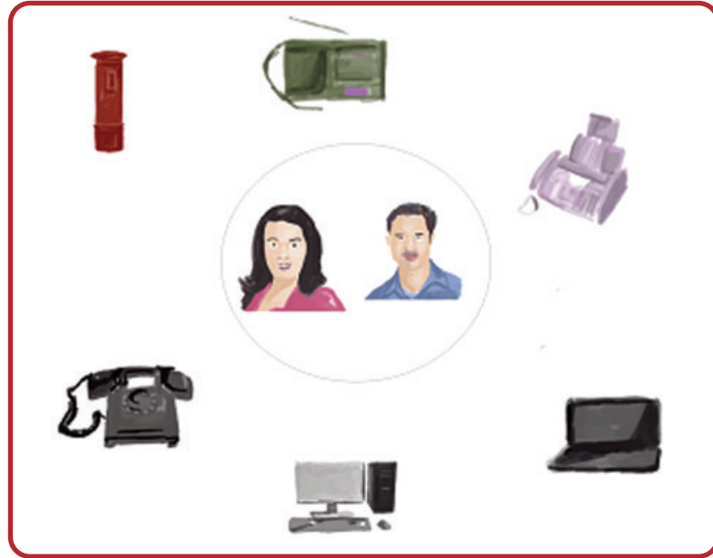
चित्र 22.2 जनमत के स्रोत

होता है; लेकिन आप दिये गये चित्र में पायेंगे कि जनमत के निर्माण में कई एजेंसियों/अभिकरणों का योगदान होता है। निम्न कुछ महत्वपूर्ण एजेंसियां हैं जो जनमत के निर्माण में सहायता करती हैं।