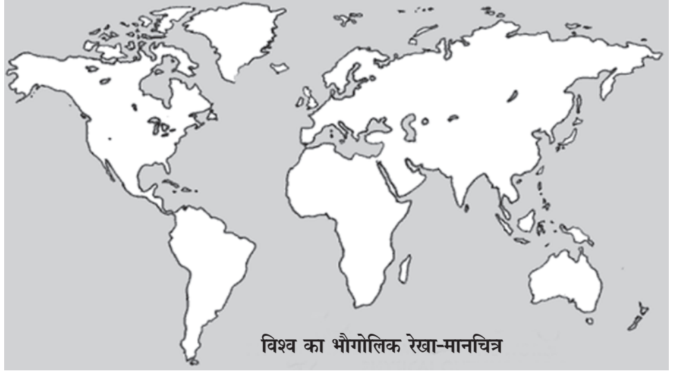
विश्व का भौगोलिक रेखा-मानचित्र