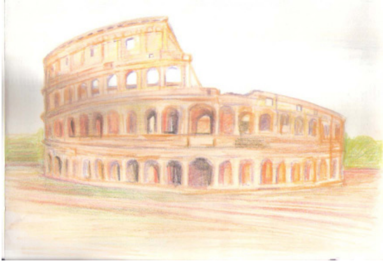
चित्र 1.3 : रोमन साम्राज्य के अवशेष

रोम एक गणराज्य था। इसके बावजूद ताकतवर और प्रभावशाली नेता सत्ता के लिए लड़े जुलियस सीजर ऐसा ही एक नेता था, जिसने जबर्दस्त शक्ति जमाकर ली थी और तानाशाह बन बैठा था। विरोधियों ने सीजर की हत्या कर दी और रोम में गृह युद्ध छिड़ गया। युद्ध के बाद आगस्टस सीजर रोम का पहला सम्राट बना। रोमन साम्राज्य तीन महाद्वीपों - यूरोप, एशिया और अफ्रीका में फैला था। आगस्टस के शासन काल में महान पैगंबर ईसा मसीह का जन्म बेथलेहम में हुआ। उन्होंने एक नए धर्म का प्रचार शुरू किया। उनके अनुसार सभी नर-नारी ईश्वर की संतान हैं। उन्होंने लोगों को एक दूसरे से मुहब्बत करना सिखाया। उनके निधन के बाद ईसा के अनुयाइयों ने उनकी शिक्षाओं को आम लोगों के बीच फैलाना शुरू किया।