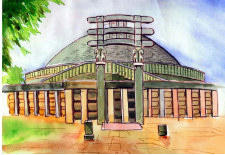
चित्र 1.5 : सांची का स्तूप

प्राचीन भारतीयों ने कला, वास्तुकला, चित्रकला और मूर्तिकला में जबरदस्त महारत दिखाई। अशोक के लाट, अजंता और एलोरा की गुफाएँ, दक्षिण भारतीय मंदिर वास्तुकला, सांची के स्तूप, मथुरा के बुद्ध के भारतीय कला के अथाह समुद्र के महल कुछ उदाहरण हैं। प्राचीन भारत में नालंदा, तक्षशिला, क्रमशिला, बलभी, काशी और कांची जैसे ज्ञान के केन्द्र थे, जहाँ भारतीय और विदेशी छात्रों को शिक्षा जाती थी। प्रसिद्ध विद्वान और शिक्षक वहाँ पढ़ाते थे। भारतीय ज्ञान और विद्वता की बाहर काफी सराहना की गई, खासकर अरब मुसलमानों द्वारा।