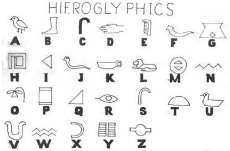
चित्र 1.2 हिरोग्लिफिक्स लिपि

फराओं ने प्राचीन विश्व के महान स्मारक पिरामिड बनवाए। मिस्रवासी मौत के बाद जिंदगी पर यकीन करते थे और इसलिए उन्होंने शवों को संरक्षित रखा। इन संरक्षित शवों को ममी कहा जाता है। पिरामिड को मृत राजाओं के ममी किए गए शवों को रखने के लिए मकबरों के रूप में बनाया गया था।