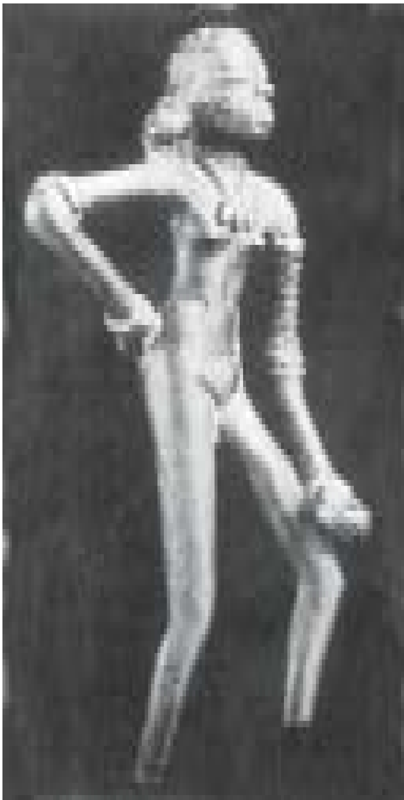
नृत्य करती हुई लड़की