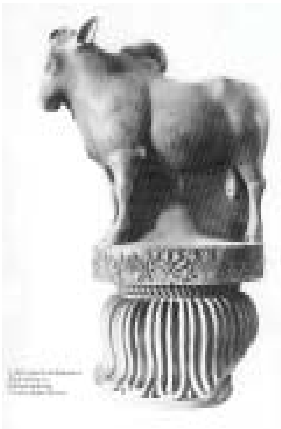
रामपुरवा बुल कॅपिटल