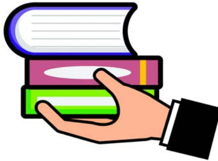
चित्र 7.1 हाथ पर लगा प्रणोद

स्वहस्ते एकं पुस्तकं स्थापयतु । पुस्तकस्य भारः यादृशः अस्ति तादृशं बलं भवतः हस्ते लम्बरेखया अधोमुखं परिणामं जनयन्ति । यतोहि कस्यचिद् वस्तुनः भाररूपं बलं समाश्रित्य पृथिवी तद् वस्तु स्वकेन्द्रं प्रति आकर्षयति । तथैव यदा भवान् वार्ताफलके कीलकं स्थापयति तदा भवान् फलके लम्बरेखया आनुभूमिकं बलप्रयोगं करोति । द्वारस्य पिधानावसरे वयं द्वारस्य पृष्ठतले लम्बरेखया बलप्रयोगं कुर्मः । अत्र सर्वेषु उदाहरणेषु पृष्ठतलानाम् उपरि लम्बरेखया बलप्रयोगो दृष्टः, अयमेव प्रणोदः इत्युच्यते ।