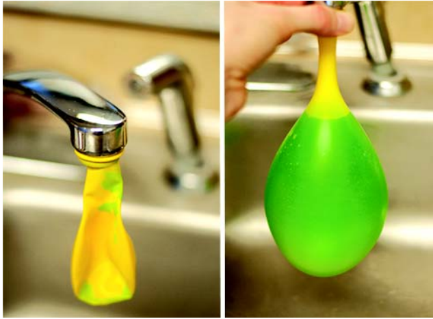
चित्र 7.3 तरल पदार्थो का पार्श्विक दबाव

आगच्छन्तु अधुना द्रवावपीडनस्य अन्यानि लक्षणानि ज्ञास्यामः—