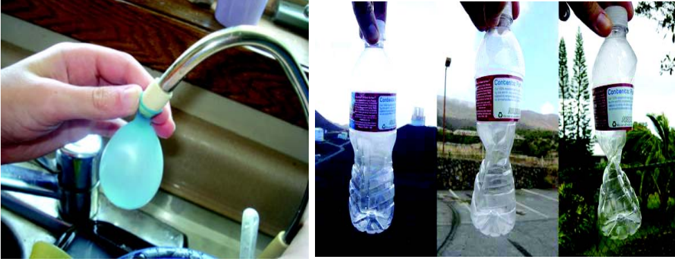
चित्रम् 7.4 वायुरपि नुदति।

fu"d"kk%& अस्मात् प्रयोगात् अयं निष्कर्षः कर्तुम् शक्यते यत् कूपी शीतला क्रियते चेत् तदन्तः स्थितम् बाष्पम् जलबिन्दुरूपेण परिणमते किञ्च अल्पम् एव जलम् बाष्परूपेण वर्तते। अत एव कूप्याम् नोदः न्यूनो भवति। वायुमण्डलीयवायोः नोदः तु अपरिवर्तितः एव अस्ति। अत एव बाह्यः अयम् नोदः कूप्याः आकारे विकृतिम् जनयति।