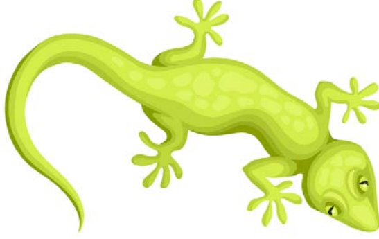
चित्रम् 7.5 गृहगोधा तस्याः पादश्च ।

fuokruL; mi ; ks%& भवताम् भित्तौ छदौ वा लग्ना गृहगोधा (ज्येष्ठी) दृष्टा स्यात् । किम् कदापि चिन्तितम् यत् सा भित्तौ कथम् लग्ना चलति । सा अस्यैव सिद्धान्तस्य उपयोगम् करोति । तेनैव नियमेन वयम् निर्वाताधारितान् बडिशान् (अङ्कुशः) भित्तौ योजयितुम् प्रयुञ्ज्मः । अङ्कुशे लग्नम् अर्धगोलाकारम् भागम् यदा भित्तौ नुदामः तदा तस्य भित्तेः च मध्यात् वायुः निःसरति । किञ्च वायुमण्डलीयः नोदः अङ्कुशम् भित्तौ नुदति । एवमेव गृहगोधा स्वपादस्य अधः अपि भवति । तस्याः पादपृष्ठस्य भित्तेः च मध्यात् वायुः निःसरति, निर्वातः च जायते । तदा वायुमण्डलीयः नोदः पादम् भित्तौ नुदति, पादश्च भित्तौ लग्नो भवति । एवम् गृहगोधा भित्तौ तथा छदौ च चलति ।