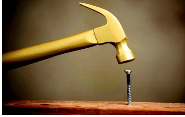
चित्र 7.2 लकड़ी में कील ठोकना

एवं वयम् अवलोकितवन्तः यत् उभयत्रापि प्रणोदः प्रायेण समः आसीत् तथापि संस्पृष्टक्षेत्रस्य आधिक्ये प्रयुक्तस्य प्रणोदस्य परिणामः न्यूनः भवति,