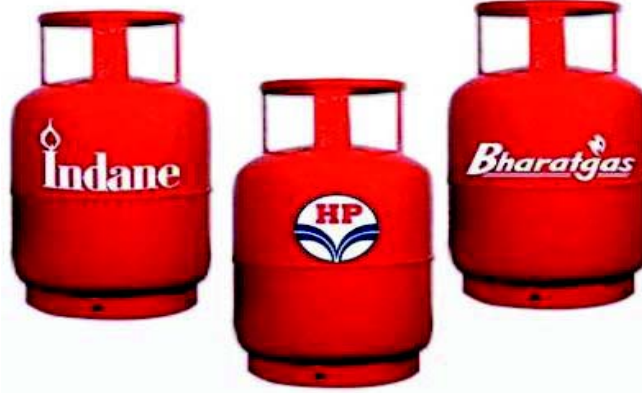
चित्रम् 3.6 वायवीयम् इन्धनम्