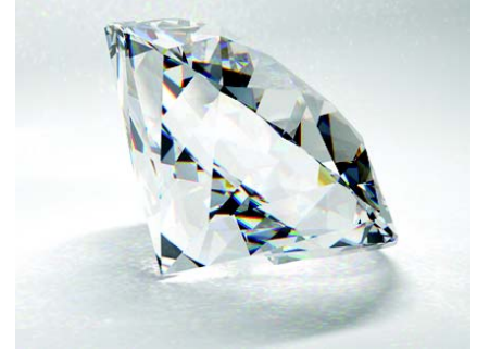
चित्रम् 3.2 हीरे की संरचना

हीरके कार्बन् इत्यस्य प्रत्येकं परमाणुः आकर्षणबलेन चतुर्भिः कार्बनपरमाणुभिः संयुतो भवति । हीरकस्य त्रिमात्रिकी संरचना भवति । हीरकस्य एवं कठोरसंरचनायाः कारणादेव हीरकम् अत्यधिकं कठोरं भवति । हीरकं पृथिवीपृष्ठात् प्रायेण 150 कि.मी. परिमिते अधः निर्मायते, यत्र भारः उष्णता च अत्यधिकं भवति । अस्माकं देशे हीरकम् मध्यप्रदेशे आन्ध्रप्रदेशे च लभ्यते ।