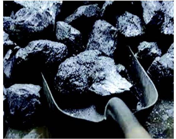
चित्रम् 3.1 कार्बन् एकम् अधातुरस्ति

एतादृशम् अङ्गारं काष्ठात्, शर्करायाः, तथा अस्थिभ्यः प्राप्तुं शक्यते । यदा एते पदार्थाः वायोः अनुपस्थित्या उष्णीक्रियन्ते तदा एतादृशानाम् अङ्गाराणां निर्माणं भवति । काष्ठात् लब्धः अङ्गारः काष्ठाङ्गारः, शर्कराया लब्धोऽङ्गारः शर्कराङ्गारः तथा जन्तुनाः अस्थिनः लब्धोऽङ्गारः अस्थ्यङ्गार इत्युच्यते । एतेषां सर्वेषां गुणे भेदो वर्तते । आगच्छतु एतेषां सर्वेषां विषये किञ्चित् ज्ञानमर्जयामः ।