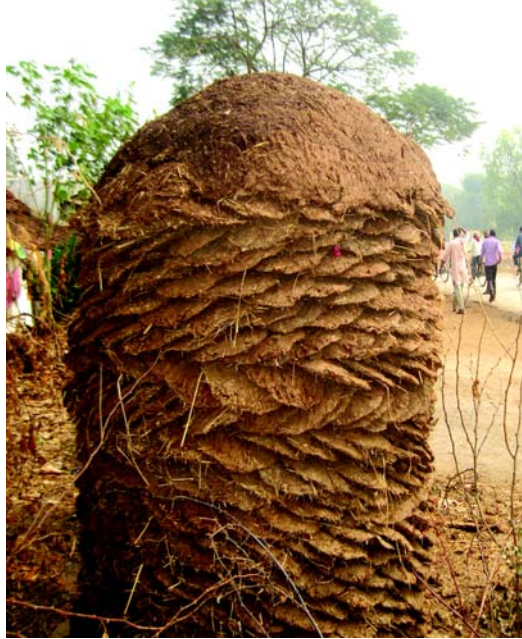
चित्रम् 3.4 कठिनं इन्धनम्