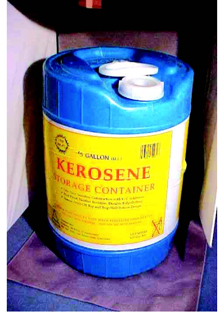
चित्रम् 3.5 द्रवम् इन्धनम्

2- æoe~bl/kue~& भवद्भिः गैलोसीन् (पेट्रोल), केरोसिन् तथा डीजल् इत्यादिकं दृष्टं स्यात् । एतानि सर्वाणि द्रवमिन्धनं भवति । भवान् जानाति वा एतत् पृथिव्याः अधः कथं निर्मितं वर्तते इति । एतदपि जीवाश्मीयम् इन्धनं भवति । लक्षाधिकवर्षात् पूर्वं सामुद्रा जीवाः वृक्षाश्च भूमेरधः गताः आसन् । पृथिव्याः अन्तः अतिभारेण अत्युष्णताया कारणेन जीवाणुनां कापि प्रक्रिया जाता, यत्र वृक्षाणां तथा जन्तूनां शरीरस्थं कार्बन् यौगिकं पेट्रोलियम्—रूपेण परिणतम् ।