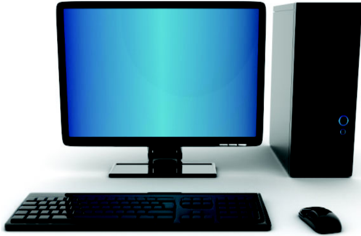
चित्र 11.2 कम्प्यूटर के मुख्य अवयव

हैं। संचार के अलावा उद्योग धंधों, चिकित्सा, विज्ञान, शिक्षा, यातायात तथा मनोरंजन के क्षेत्र में भी कम्प्यूटर का उपयोग किया जा रहा है।