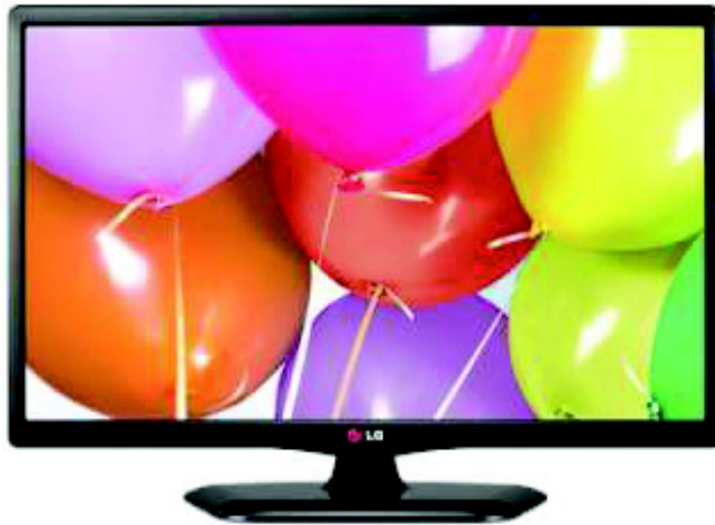
चित्र 11.1 टेलीविजन

टेलीविजन यानी दूरदर्शन ने तो संचार के क्षेत्र में क्रांति ही जा दी है। दूरदर्शन की सहायता से हम न केवल समाचार और महत्वपूर्ण घटनाओं के बारे में जानकारी लेते हैं बल्कि मनोरंजक एवं शिक्षा संबंधी कार्यक्रम भी देखते हैं। दूरदर्शन स्टेशन मिश्रित वीडियो संकेतों को भेजने तथा ध्वनि संकेतों को मोड्यूलेटेड संकेतों के रूप में ऐण्टिना दूरदर्शन केंद्र से भेजे गये दूरदर्शन संकेतों को ग्रहण कर लेता है। मिश्रित वीडियो तथा ध्वनि संकेत सामान्य संकेतों के परिपथ से फोटो के रूप में आ जाते हैं। ध्वनि संकेत अलग कर