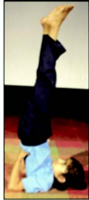
चित्रम् 8.13 सर्वांगासनम्