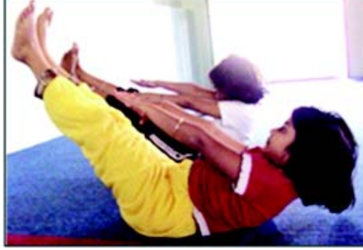
चित्रम् 8.3 नावसनाश्वसनम्