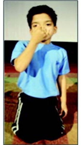
चित्रम् 8.18 कपालभाती