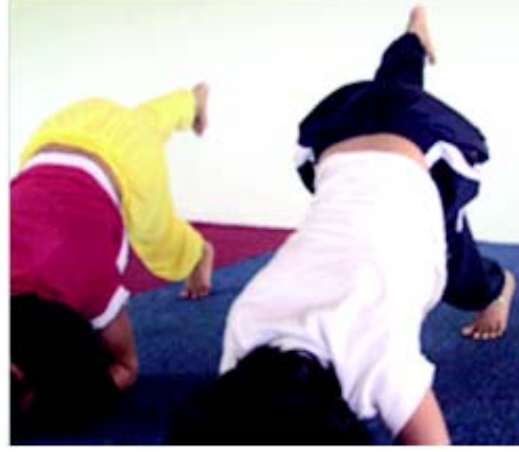
चित्रम् 8.8 उत्थित-अर्ध-शीर्षासनम्