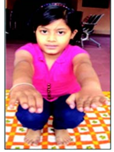
चित्रम् 8.7 उत्तिष्ठनम् – उपविषनम्