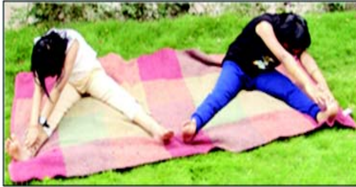
चित्रम् 8.5 मेरुदण्डस्य कर्षणम्