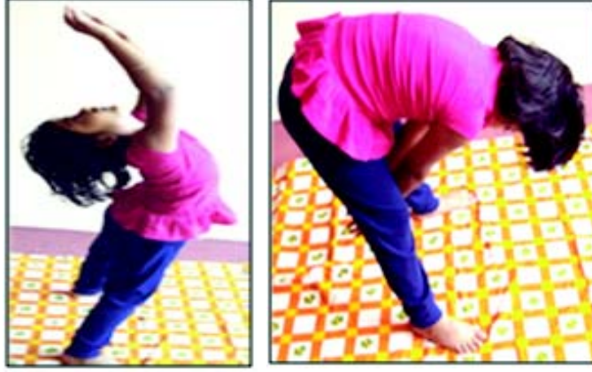
चित्रम् 8.4 प्रसारितपादहस्तासनम्