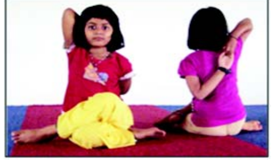
चित्रम् 8.12 गोमुखासनम्