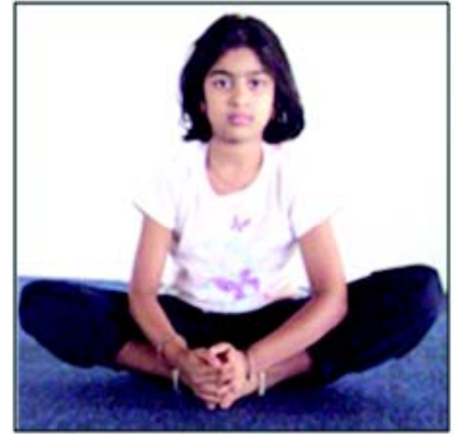
चित्रम् 8.15 बद्ध कोणासन