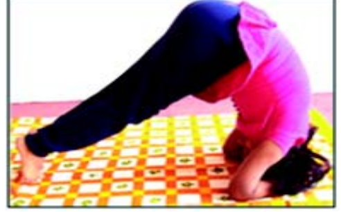
चित्रम् 8.14 अर्ध शीर्षासनम्