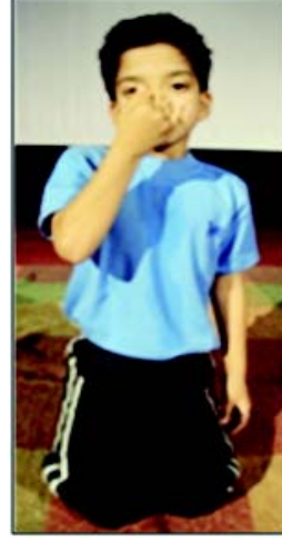
चित्रम् 8.17 सूर्यनुलोमविलोमः