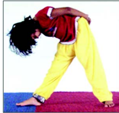
चित्रम् 8.16 पार्श्व-उत्थान-आसनम्