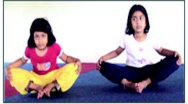
चित्रम् 8.9 बटरपलाई-स्ट्रेच