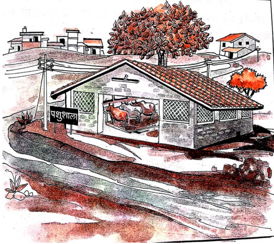
चित्रम् 4.1 गोशालाम्

भारते प्रायः कृषकानां गृहाणि मृत्तिकायाः ईष्टिकाभिः निर्मिताः भवन्ति । तथा सम्पूर्णगृहस्य तलं गोमयेन लेपितो भवति । प्रायः बहुक्षेत्रेषु नवीनभवन निर्माणसामग्र्या प्रयोगेण एषा परम्परा न्युना भवन्त्यस्ति ।