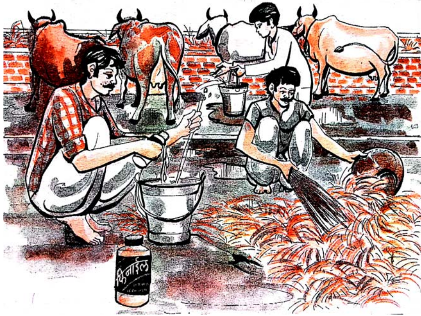
चित्रम् 4.4 गोशालायां—स्वच्छता