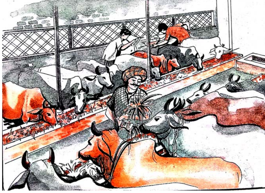
चित्रम् 4.2 गोशाला-दृश्यम्