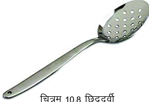
चित्रम् 10.8 छिद्रदर्वी

fNænohZ & एषा छिद्रयुक्ता भवति येन भोजनपदार्थेभ्यः तैलं तथा घृतं पृथक् भवति । एषा गहनतलने तथा भोजनपरिवेशने प्रयुक्ता भवति । एषा अधिकतरं स्टील, आयस्कः, एल्युमीनियम तथा कांसः इत्यादिपात्रैः निर्मिताः भवन्ति ।