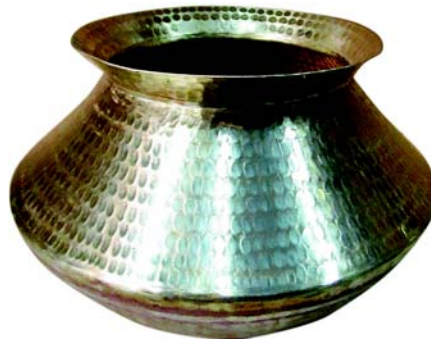
चित्रम् 10.7 डेकचीपात्रम्

rflrdk & एतत् गोलाकारं पात्रम् अस्ति, यस्य प्रयोगः रोटिकायाः निर्माणे भवति । एतत् चिक्कणतायुक्तमृत्तिकया, एल्युमीनियम, आयस्कः इत्यादीनां निर्मितं भवति । वयं तप्तिकायां चित्रापूपः, प्ररोटिकां निर्मातुं शक्यते । तप्तिका स्थूलतलस्य लोहस्य निर्मिता भवति । तप्तिकाः अनेकाकारयुक्ताः भारे सामग्रीभिः निर्मिताः भवन्ति । अद्यत्वे 'नॉन-स्टिच' तप्तिकाः अपि उपलब्धाः सन्ति येषु भोजनं संश्लिष्टं न भवति ।