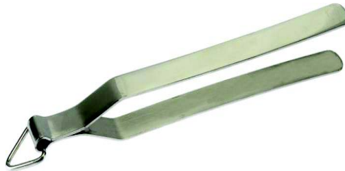
चित्रम् 10.11 सन्दंशः

I Und k% ¼peVk½ & एत् धातुनिर्मितं भोजनोपकरणं वर्तते यस्यप्रयोगः पाकशालायां पात्रं धारणार्थं क्रियते । उदाहरणाय तापे रोटिकां धमनार्थं क्रियते कमपि धारकहीनं लघु तथा उष्णपात्रं धारणाय अस्य प्रयोगो भवति ।