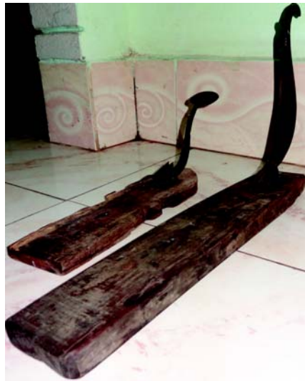
चित्रा 10.13 शाककर्तरी

'kkddrjh & बंगालप्रदेशस्य प्रसिद्धं शाककर्तरी भोजनोपकरणम् अस्ति अस्यप्रयोगः शाककर्तने भवति । अस्याग्रभागो क्षुरपत्रवत् भवति तथा शाककर्तने अस्य प्रयोगो भवति ।