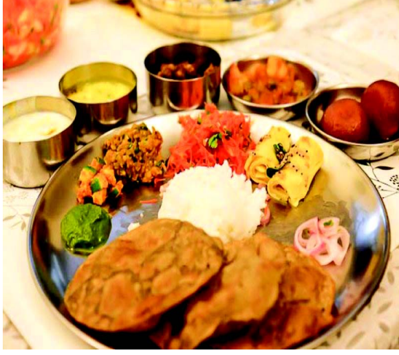
चित्रा 10.5 स्थालिकायां भोजनपरिवेशनस्य

स्थालिकायां भोजनपरिवेशनं वामतः प्रारम्भः भवति तथा दक्षिणपर्यन्तं भवति । प्रायः स्थालिकायाम् अल्पप्रयुक्तानि वस्तुनि यथा लवणं, निबुकम्, अवलेहः, दाधेयम्, तथा सन्धितम् वामे सुष्कशाकं मध्ये ओदनं तथा तत्सम्बन्धितानि भोज्यपदार्थानि भवन्ति । तैलीयपदार्थानां कटोरीषु परिवेशनं भवति ।