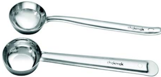
चित्रम् 10.15 दर्वी

noh & अस्य प्रयोगः – ओदनं, शाकं इत्यादीनां परिवेशने भवति । अस्याकारः चमसः रूपे क्रियते । एषा किञ्चित् गाम्भीर्ययुक्ता भवति । एषा आयस्केन, स्टील, आयस्कः, एल्युमीनियम इत्यादिभिः निर्मिता भवति ।