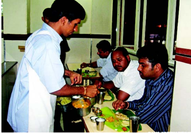
चित्रा 10.1 पान्थशालायां भोजनपरिवेशनम्

सुव्यवस्थितरूपेण परिविश्यते । अत्र आगन्तुकाः स्वयं तथा अतिथयः कर्मचारिभिः भोजनं परिवेशितुं शक्यन्ते । यदा भोजनं उन्नतोत्पीठिकायां स्थाप्यते तं सः (Buffet) व्यवस्था कथ्यते ।