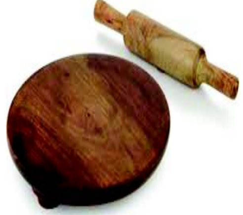
चित्रम् 10.6 पिष्टशिला, बेल्लनम्

fi f'Vf'kyk| çYue~& एकः गोलाकारः दृढतमः पात्रं भवति एतत् काष्ठेन, मार्बलशिलया अथवा प्लास्टिकादिभिः निर्मितं भवति । एतत् गोलाकारयुक्तेन बेल्लनेन (Rolling pin) सह प्रयुक्तो भवति । बेल्लनम् आर्द्रचूर्णं गोलाकारं करणार्थं पिष्टशिलया सहायतया तथैव परिवर्तितं करोति । बेल्लनं अधिकाधिकं काष्ठेन निर्मितं भवति तथा अनेकाकारेषु भवति ।