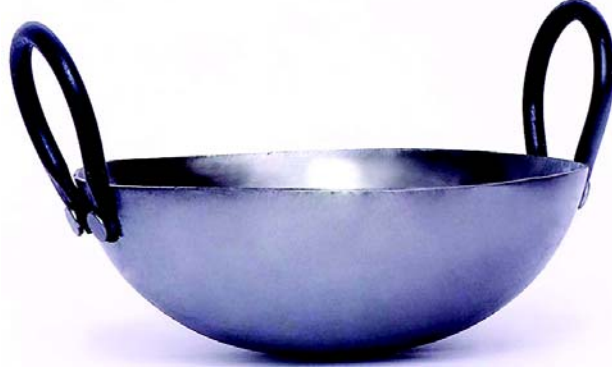
चित्रम् 10.14 समभ्राष्ट्रम्

I eHk"Ve~1d<kb71& अस्यप्रयोगः तलनार्थम् अधिकं भवति एतत् आयस्केन तथा 'एल्युमीनियम' धातुभिः निर्मितम् अस्ति । अस्याधिकः प्रयोगः शुष्कशाकं निर्माणार्थं भवति अस्मिन् शाकस्य सरलतया चालनं भवति ।