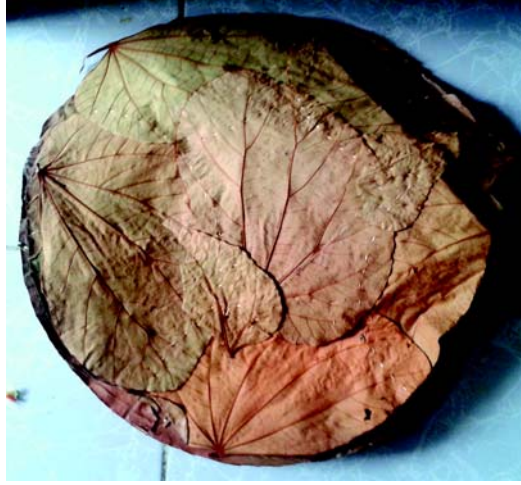
चित्रम् 10.3 पत्तलम्

पत्राणां प्रयोगः पुरातनकाले भोजनपरिवेसने भवति स्म । नूतनानां पत्राणां स्थालिकावत् भोजनपरिवेशने प्रयोगं भवति स्म । एतत् प्रचलनं भारतस्य दक्षिणेषु क्षेत्रेषु तथा पश्चिमक्षेत्रेषु सम्प्रति अपि प्राप्यते । दक्षिणभारतीयाः सरलोपभ्यमानेषु कदलीपत्रेषु भोजनं परिवेशयन्ति स्म । एतानि सामान्यपत्राकाराणाम् अपेक्षा दीर्घतमः तथा स्थूलतमाः भवन्ति । एतानि स्थालिकायाः रूपे प्रयुक्ताः भवितुं शक्नुवन्ति ।