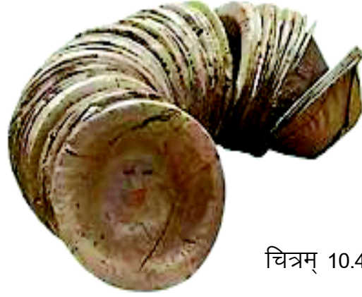
चित्रम् 10.4 दोना इति

प्लाटेनपत्राणि, बस्टर्डटीकपत्राणि, रिनिकममक्यूनिमपत्राणि, कैलट्रोपिसपत्राणि, कैसटरपत्राणि, सीहीटमिल्कीसैपपत्राणि, लोट्सपत्राणि, डाहितानस्क्रीयूपाइनपत्राणि, स्टीरियो, स्वरपमसावोलिंगपत्राणि इत्यादयः ।