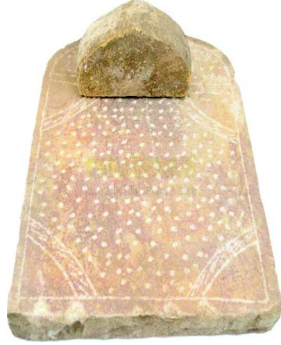
चित्रम् 10.12 शिलापट्टं तथा शिलावटकम्

'kkddrjh & बंगालप्रदेशस्य प्रसिद्धं शाककर्तरी भोजनोपकरणम् अस्ति अस्यप्रयोगः शाककर्तने भवति । अस्याग्रभागो क्षुरपत्रवत् भवति तथा शाककर्तने अस्य प्रयोगो भवति ।