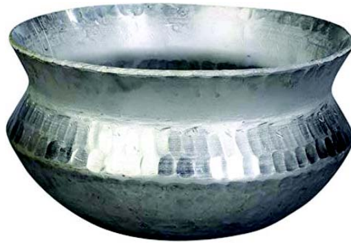
चित्रा 10.9 भ्राष्ट्रम्

Hkk"VEk~& अधिकतः तण्डूलान् पचनाय अस्य पात्रस्य प्रयोगो भवति । एतत् चिक्कणमृत्तिकया, स्टील, आयस्कः, एल्युमीनियम इत्यादिभिः निर्मितः भवति । डेकचीपात्रवत् अस्याकारं भोजनपचने सहायं करोति । अस्मिन् भोजनं शीघ्रं