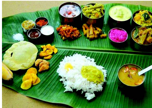
चित्रम् 10.4 कदलीपत्रेषु भोजनपरिवेशणम्

कदलीपत्रेषु भोजनं अनेकाः संस्कृतयः अनेकधा कुर्वन्ति । कदलीपत्राणां प्रयोगः एवं क्रियते यत् तस्य दीर्घतमो भागः दक्षिणभागे भवेत् न्यूनप्रयुक्तानां वस्तूनां प्रयोगः वामे भवति यथा – द्विदलं, ओदनं, दधि, सन्धितम्, इत्यादिनि वस्तूनि दक्षिणे स्थाप्यते ।