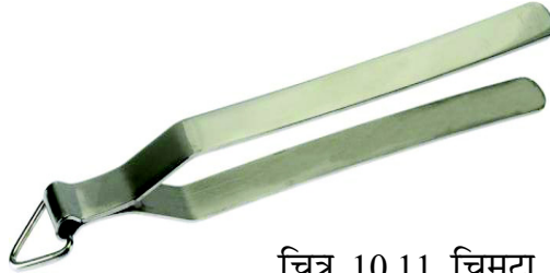
चित्र 10.11 चिमटा

सारमी या चिमटा या संडासी यह लंबे धातु के बर्तन होते हैं, जिनका प्रयोग रसोई में किसी भी बर्तन को पकड़ने के लिए किया जाता है। उदाहरण के लिए ये आंच पर रोटी फुलाने के लिए काम आता है। किसी बिना हैंडल के छोटे अथवा गर्म बर्तन को पकड़ने हेतु भी प्रयोग किया जाता है।