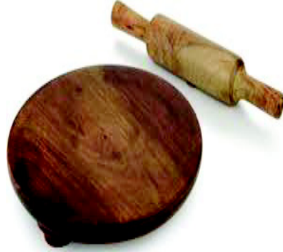
चित्र 10.6 चकला बेलन

चकला बेलन एक गोलाकार (सख्त सतह वाला) बर्तन होता है। यह पत्थर, मार्बल, लकड़ी, प्लास्टिक आदि का बना होता है। यह गोल-गोल बेलन (Rolling pin) के साथ प्रयुक्त होता है। बेलन गोलाकार आटे के लोए को चकले की मदद से रोटी (पतली सतह) में परिवर्तित करता है। बेलन अधिकतर लकड़ी का बना होता है तथा अनेक आकार में आता है।