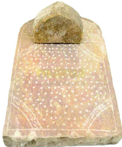
चित्र 10.12 सिल बट्टा

सिल बट्टा अथवा शिलनोड । पत्थर से बना हुआ बर्तन है। यह मसाला पीसने या चटनी बनाने के लिए प्रयुक्त होता है।