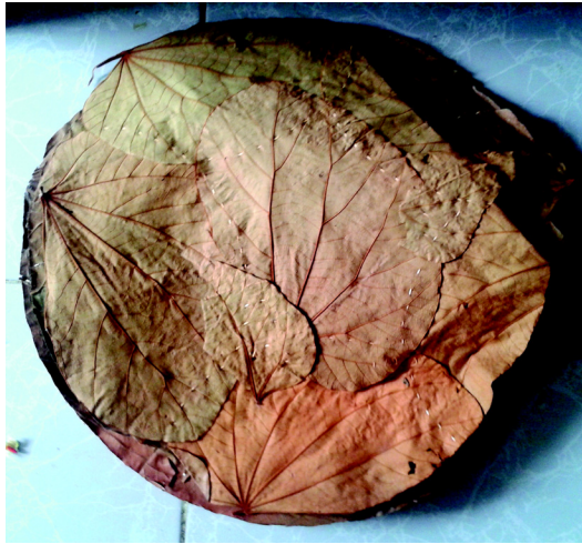
चित्र 10.3 पत्तल

पत्तों का प्रयोग प्राचीन समय में भोजन परोसने के लिए किया जाता था। ताजा पत्तों को प्लेट की भांति प्रयोग करने का प्रचलन था। यह प्रचलन भारत के दक्षिणी एवं पश्चिमी क्षेत्रों में यह अभी भी पाया जाता है। दक्षिण भारतीय आसानी से उपलब्ध केले के पत्तों पर भोजन परोसते हैं। यह पत्ते आकार में बड़े तथा मोटे होते हैं। यह प्लेट के रूप में आसानी से प्रयुक्त हो सकते हैं।