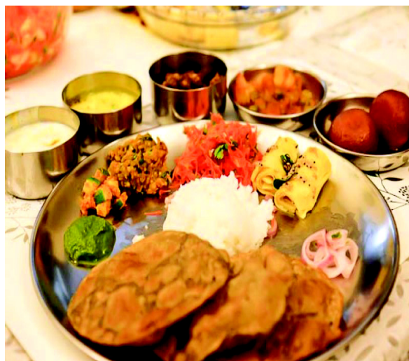
चित्र 10.5 प्लेट में भोजन परोसना

प्लेट में भोजन परोसने की विधि बायीं तरफ से शुरू होकर दायीं तरफ जाती है। हमने अधिकतर यह देखा है कि कम प्रयुक्त चीजें जैसे नमक, नींबू, चटनी, रायता और आचार बायीं तरफ तथा सूखी सब्जी दायीं तरफ तथा मध्य में चावल या उससे संबंधित भोजन पदार्थ रखे जाते हैं। तैलीय पदार्थ छोटी कटोरियों या कटोरे में परोसे जाते हैं।