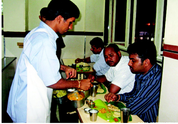
चित्र 10.1 रेस्तरां/होटल में भोजन परोसना

रेस्तरां में भोजन मीनू में से अपने पसंद का चुना जाता है। यह भोजन मेहमानों को सुव्यवस्थित रूप से परोसा जाता है। यहां मेहमान स्वयं अथवा रेस्तरां कर्मचारियों द्वारा भोजन परोसवा सकते हैं। जब भोजन बड़े मेज पर रखा जाता है जिसे बैरे परोसते हैं, वह बैफेट (Buffet) व्यवस्था कहलाती है।