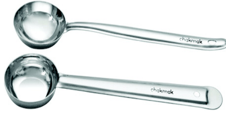
चित्र 10.15 कडछी

होती है। इसका आकार एक बड़े चम्मच के रूप में होता है। यह थोड़ी गहरी होती है। यह स्टील, लोहा, एल्युमीनियम, कांसा, लकड़ी आदि की होती है।