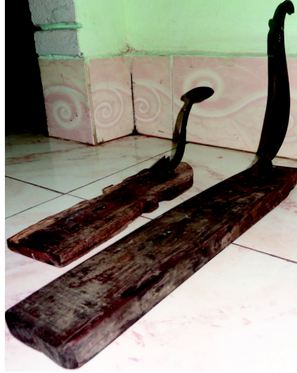
चित्र 10.13 पिरडाई

बोटी, दाओ दा या पिराडी बंगाल की घुमावदार काटने वाली ब्लेड का बर्तन है। यह ब्लेड लकड़ी के आधार पर स्थित होती है तथा सब्जियां काटने के काम आती है।