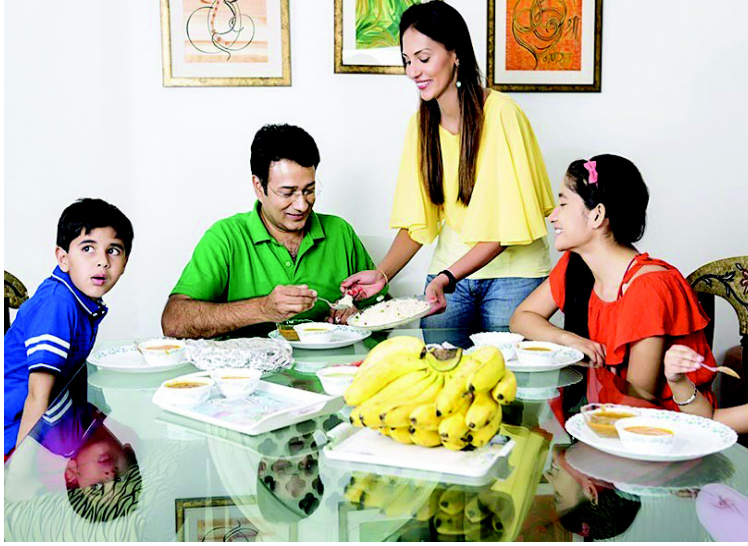
चित्र 10.2 घर पर भोजन परोसना

खाना खाया जाता है। अधिकतर यह खाने का स्वाद, सुगंध, देखने और छूने से बढ़ा देता है।