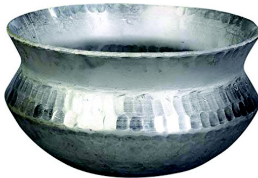
चित्र 10.9 हांडी

हांडी अधिकतर चावल पकाने के लिए प्रयुक्त होने वाला बर्तन है। यह चिकनी मिट्टी, एल्युमीनियम, स्टील अथवा कांसे से बनी होती है। डेकची की भांति इसका आकार भोजन पकाने में मदद करता है। इसमें भोजन जल्दी बन जाता है। पोषक तत्व एवं स्वाद के लिए मिट्टी के बर्तन बेहद अच्छे होते हैं। इसमें हर प्रकार का भोजन बनाया जा सकता है। धीमा भोजन पकाने से यह बर्तन भोजन की गुणवत्ता एवं स्वाद बढ़ाते हैं। इनमें पोषक तत्वों का स्तर भी संतुलित रहता है।