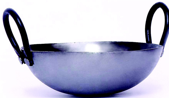
चित्र 10.14 कडाही

कडाही या वोक यह तलने में मुख्य रूप से काम आती है। यह लोहे या एल्युमीनियम की बनी होती है। यह अधिकतर सूखी सब्जियों के लिए प्रयोग की जाती है। इसमें सब्जियों को आसानी से चलाया जा सकता है।