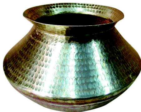
चित्र 10.7 डेकची

डेकची उबालने या तरलदार सब्जी बनाने के लिए प्रयुक्त की जाती है। यह तांबा, कांसे या एल्युमीनियम की बनी होती है। डेकची के आकार के कारण भोजन पदार्थों को समान ताप प्राप्त होता है।