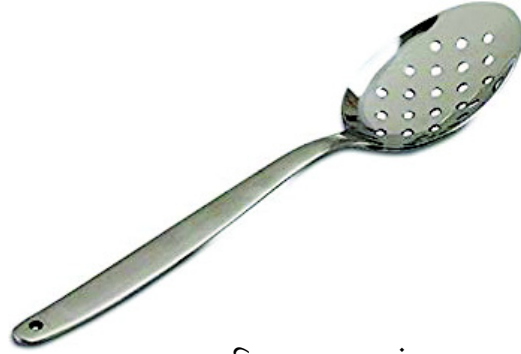
चित्र 10.8 छांटा

झंझरी/छांटा/पोनी एक छिलनीदार चम्मच होती है जिससे भोजन पदार्थ एवं तेल/घी अलग होते हैं। यह गहरे तलने अथवा भोजन परोसने के लिए प्रयुक्त होती है। यह अधिकतर स्टील, लोहा, एल्युमीनियम या कांसे की बनी होती हैं।