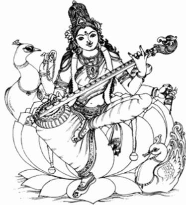
चित्र 1.1 देवी सरस्वती