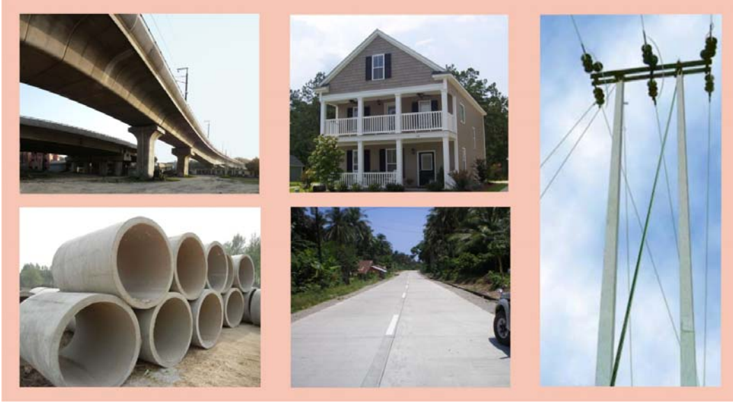
चित्रम् 2.2 वज्रचूर्णस्य प्रयोगम्

आधुनिकपोर्टलैण्डवज्रचूर्णे षष्टितः सप्तषष्टिप्रतिशतं यावत् कैलसियम् अक्साइड सप्तदशतः पञ्चविंशतिप्रतिशतपर्यन्तं सिलिका त्रिभ्यः अष्टौप्रतिशतं यावत् आयरन् आक्साइड तिष्ठति। चूनाप्रस्तरं चिककणमृदं च संपेष्य अपेक्षितानुपातेन मिश्रीयते । भट्टी (Rotary kiln) इत्यस्मिन् च 1150 केल्विन्पर्यन्तम् उष्णत्वं सम्पाद्यते । एवम्रकारेण प्राप्तः पदार्थः किलंकर (Clinker) इत्युच्यते । किलंकर इत्यस्मिन् किञ्चिन्मात्रेण जिप्सम् संमिश्र्य वज्रचूर्णः प्राप्यते ।