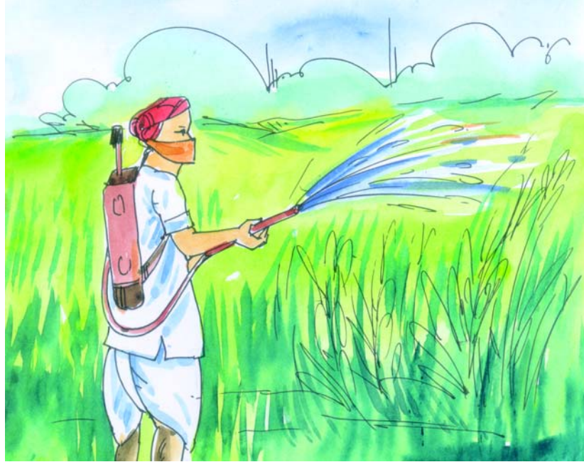
चित्रम् 2.3 उर्वरकम् कीटनाशकञ्च

कीटनाशकम् (Pesticides)- अनपेक्षितान् कीटान् हन्ति अथवा तेषां विस्तारं