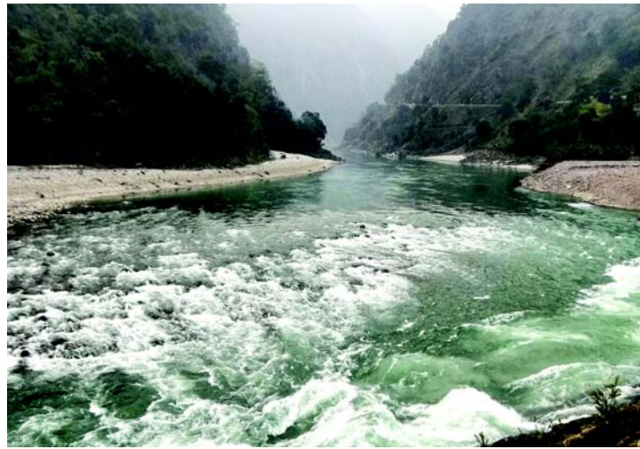
चित्रम् 6.5 नदी रूपे जलं प्रवाहं प्राप्नोति

वेदेषु कथितम् अस्ति यत् वर्षया जले प्रवाहः आगच्छति तथा नदी रूपे जलं प्रवाहं प्राप्नोति । प्रवाहयुक्तं जलम् अस्माकं संस्कृतौ पवित्रं मन्यते । तदैव अस्माकं संस्कृतौ नदीं मातृवत् पूजनीया मन्यन्ते । नदीनां पवित्रतायाः सम्बन्धे वैदिकसाहित्ये कथितम् अस्ति यत् एतादृशी नदी या पर्वततः निर्गम्य समुद्रपर्यन्तं प्रवाहितं भवति सा पवित्रा भवति । अनेन माध्यमेन वैदिकर्षयः एवं सन्देशं यच्छन्ति यत् नदीनां अबाधः प्रवाहः संरक्षणीयः । नद्यः प्रवाहितव्यः ।