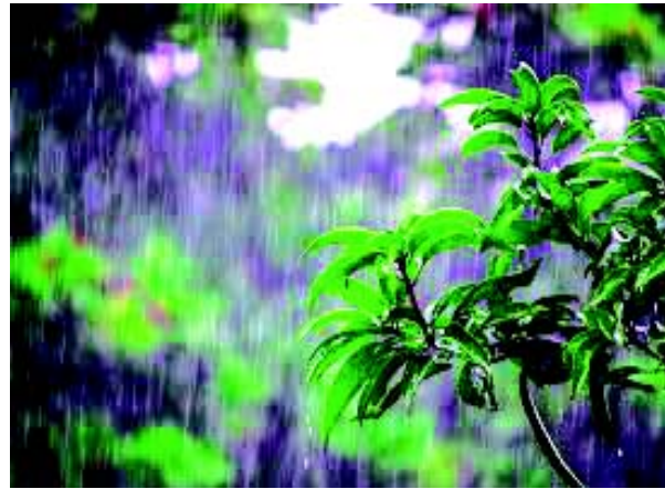
चित्रम् 6.4 वर्षा-जलम्