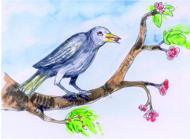
चित्रम् 1.2 जीवात्मा—रूपकम्

अत्र यः प्रथमो पक्षी वर्तते सः जीवात्मानः रूपकः अस्ति तथा सः कर्मकर्ता अस्ति, तथा यः निरीक्षणकर्तास्ति सः परमात्मानः रूपकः अस्ति, सः प्रथमपक्षिणं तस्य कर्माणां फलं प्रदानाय गतिविधिनां सूक्ष्मनिरीक्षणं कुर्वन् अस्ति । अस्याः ऋचातः एतत् व्यक्तः भवति यत् सृष्टेः निर्माणे प्रमुखरूपेण तत्त्वद्वयम् अस्ति ।