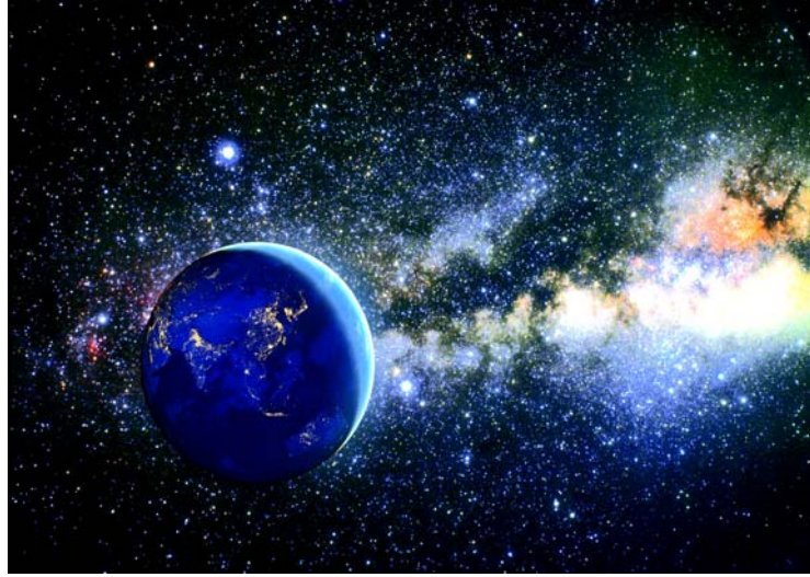
चित्रम् 1.1 सृष्टिः

उक्तर्चायां कथितम् अस्ति यत् सर्वशक्तिमानपरमात्मा सहस्रशिरयुक्तः, सहस्रनयनयुक्तः, तथा सहस्रपादयुक्तः अस्ति सः सम्पूर्णे ब्रह्माण्डे व्याप्तः अस्ति । परमात्मा यः जगतः निर्माता अस्ति, सः सम्पूर्णप्रकृतिं सर्वतः परिक्राम्यित्वा अस्मात् दशङ्गुलोपरि स्थितः अस्ति । अत्र सर्वशक्तिमानस्य कार्यरतैः शक्तिभिः माध्यमेन सृष्टेः रचना कथिता ।