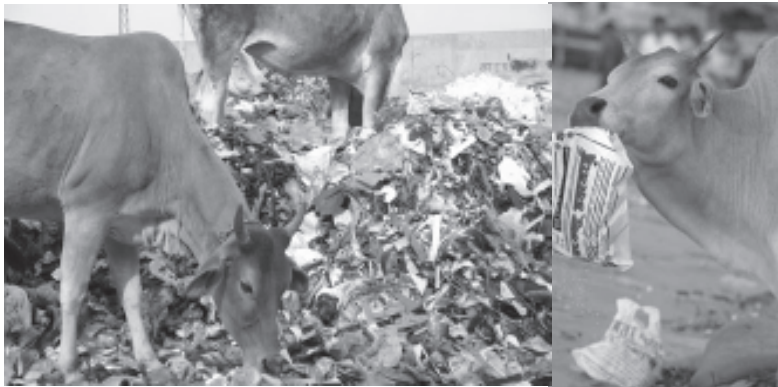
चित्र 10.3: प्लास्टिक थैलियों का ढेर के साथ अन्य बचे खुचे सामान को गायें खा रही है

प्लास्टिक थैलियां- कम घनत्व वाली पोलिथीन (Low density polythylene, LDPE) से प्लास्टिक थैलियां बनती हैं जो वास्तव में कभी भी नष्ट नहीं होती हैं, इसके कारण एक विकराल पर्यावरणीय संकट उत्पन्न हो गया है। फैंकी हुई थैलियां नालियों को और सीवेज व्यवस्था को बंद कर देती हैं। उन थैलियों में बचा खुचा खाना या सब्जी आदि के छिलके फेंकने से गायें और कुत्ते उन्हें वैसे ही खा लेते हैं और प्लास्टिक के कारण दम घुटने से उनकी मौत हो सकती है। प्लास्टिक एक अजैव निम्नकरणीय पदार्थ है और प्लास्टिक के कूड़े के ढेर के साथ जलने पर अत्यधिक विषालु और जहरीली गैसें जैसे कार्बन मोनोक्साइड, कार्बन डाइऑक्साइड, फॉस्जीन, डायोक्सिन और अन्य जहरीले क्लोरीनीकृत यौगिक निकलते हैं।