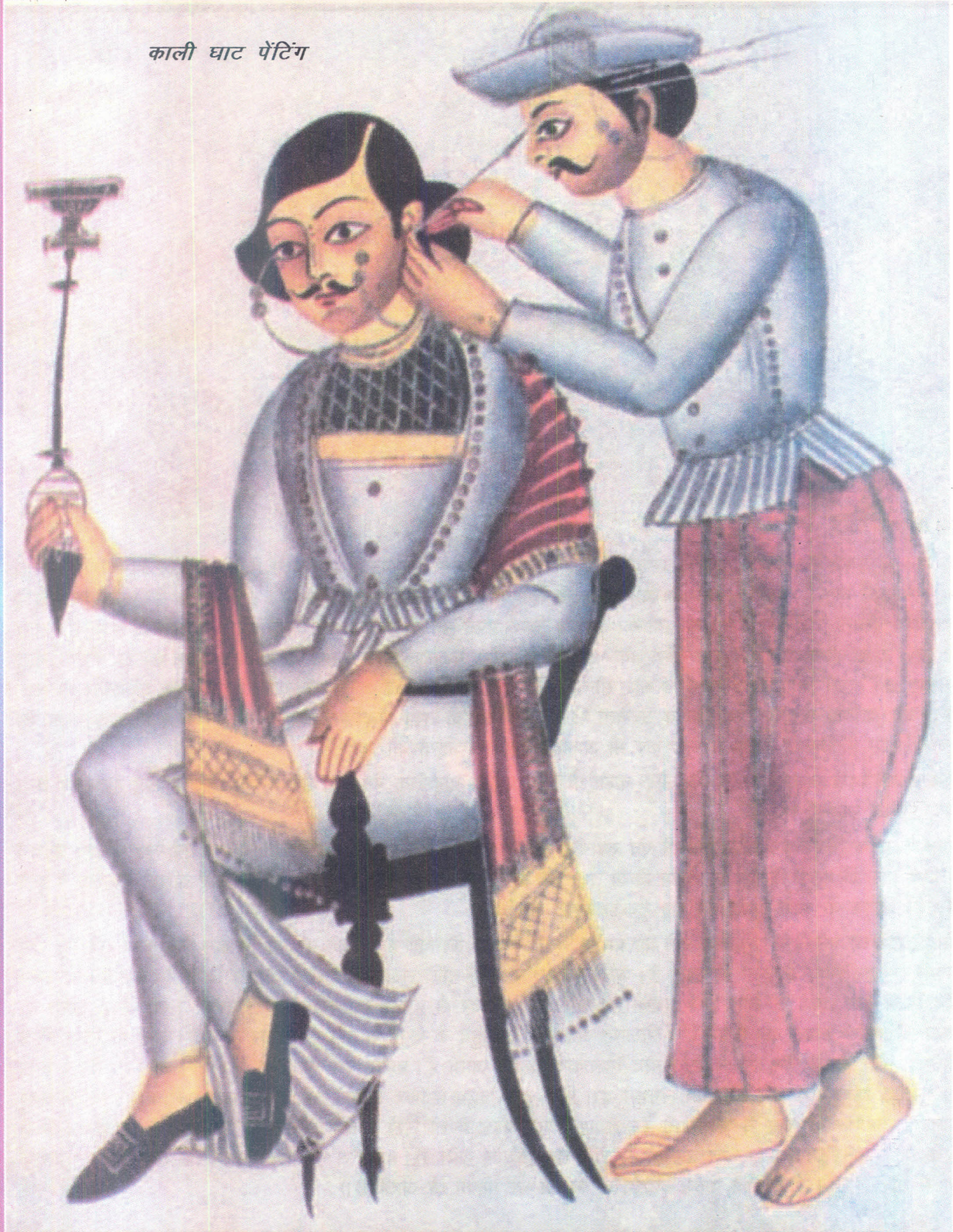
काली घाट पेंटिंग