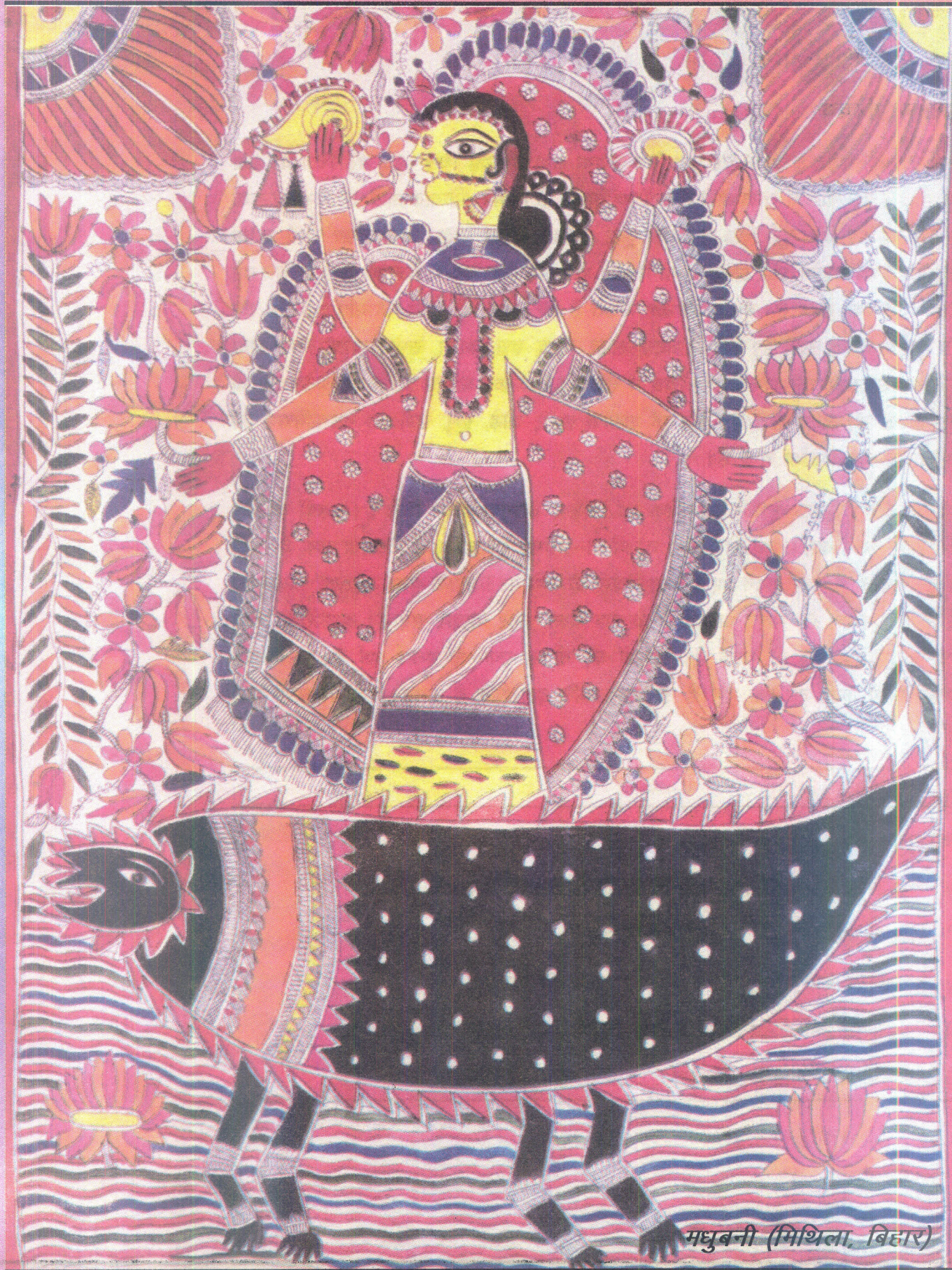
मधुबनी (मिथिला, बिहार)