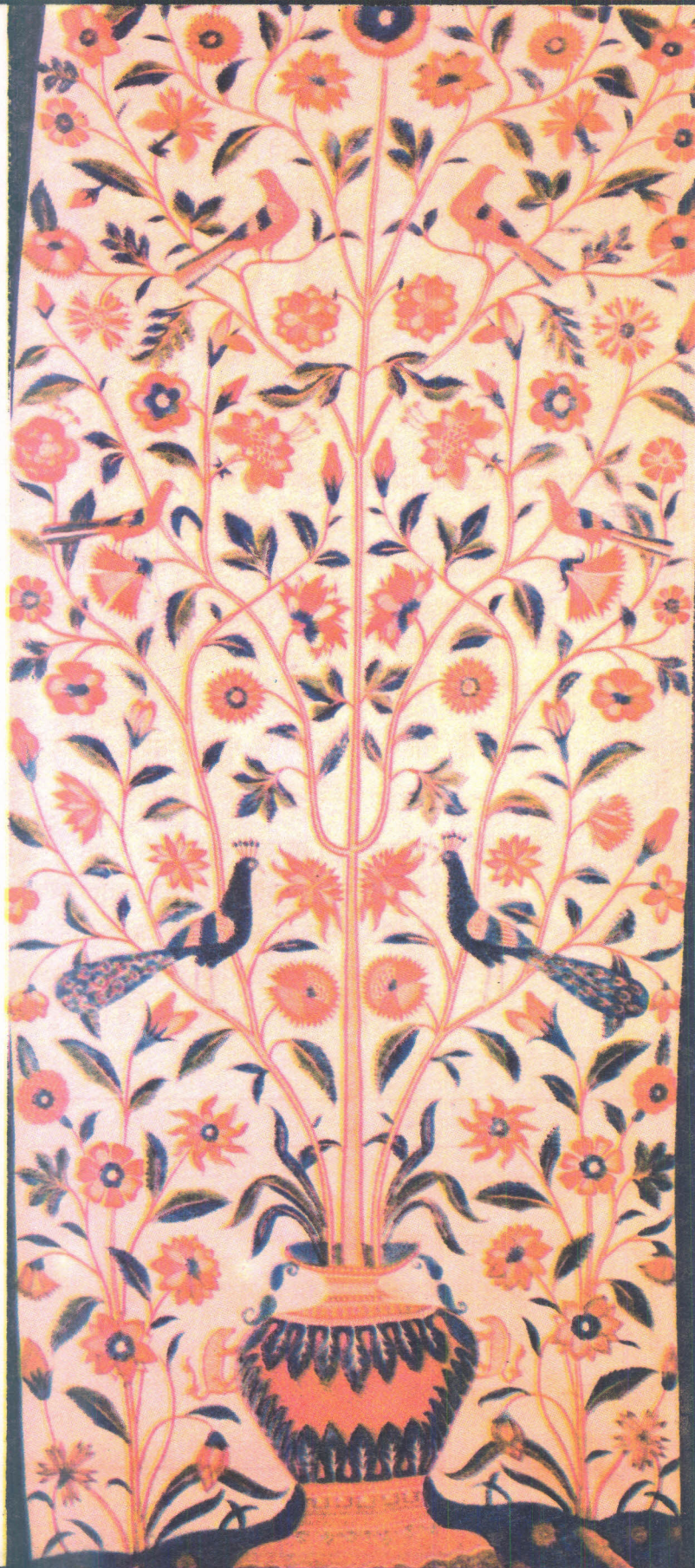
कलमकारी (आंध्र प्रदेश)