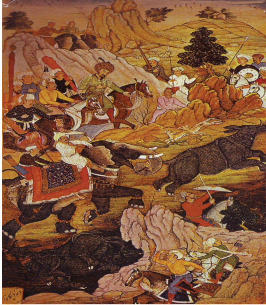
चित्र 7.1: गैंडे का शिकार करते बाबर

में बाबर ने एक गैंडे का शिकार किया है। हाथी के आक्रामक व्यवहार से ज्ञात होता है कि उसे शिकार के लिए किस प्रकार प्रशिक्षित किया गया है। लघुचित्र छोटे आकार में बनाए जाने वाले चित्र थे, जिनमें चित्रकार अक्सर छोटे-से-छोटे विवरण भी चित्रित करते थे। सामान्यतः ये चित्र किसी पुस्तक या चित्र-संग्रह के अंग होते थे।