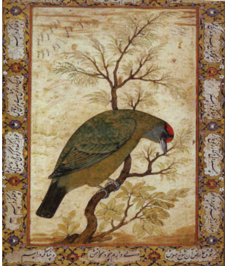
चित्र 7.3: बारबेट

यह लघुचित्र जहाँगीर काल का है। जहाँगीर प्रकृति का महान प्रेमी था। उसके समय में सबसे अधिक चित्र पशु-पक्षियों के बनाए गए। बारबेट नामक यह चित्र प्रसिद्ध चित्रकार उस्ताद मंसूर द्वारा चित्रित किया गया एक महान चित्र है। उस्ताद मंसूर, जहाँगीर के दरबार के ख्याति प्राप्त चित्रकार थे। व्यक्ति चित्र (शबीह) बनाने में सबसे कुशल चित्रकार तो थे ही साथ ही उनका पक्षी-अध्ययन आश्चर्यजनक था। यह लघुचित्र मुगलकालीन चित्रकला का एक अनुपम उदाहरण है। इस चित्र में पेड़ के तनों, पत्तियों, पहाड़ियों का महीन तथा कोमल रेखाओं द्वारा सजीव चित्रण वास्तव में मुगल चित्रकारों द्वारा सूक्ष्म प्रकृति अध्ययन को दर्शाता है, जिससे चित्र में यथार्थवादी प्रभाव उत्पन्न हो गया है।