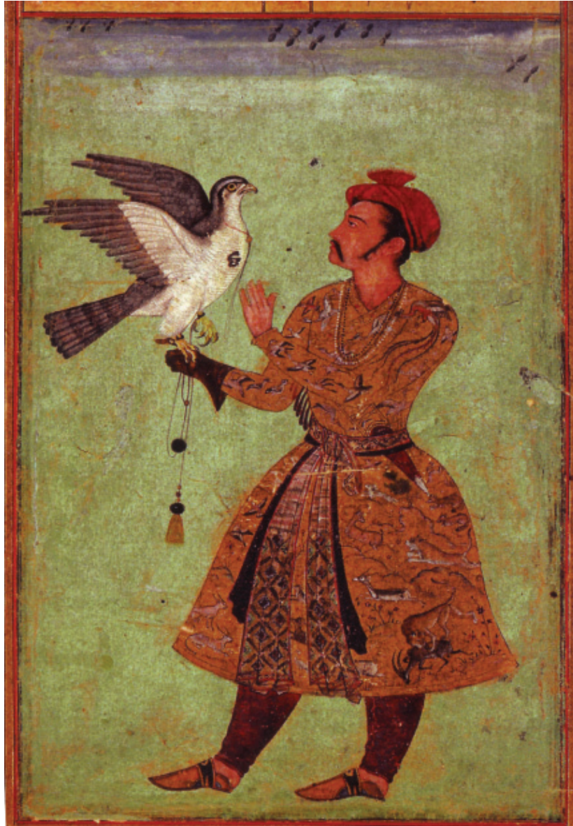
चित्र 7.2: बाज के साथ राजकुमार

उस्ताद मंसूर नामक महान चित्रकार द्वारा बनाया गया यह लघु चित्र 'बाज के साथ राजकुमार' जहाँगीर काल का है। जहाँगीर के दरबार में उस्ताद मंसूर ख्यातिलब्ध चित्रकार थे जो लघु चित्र बनाने में माहिर थे। यह चित्र मुगलकाल में उनके द्वारा बनाया गया एक उच्च श्रेणी का लघुचित्र है।