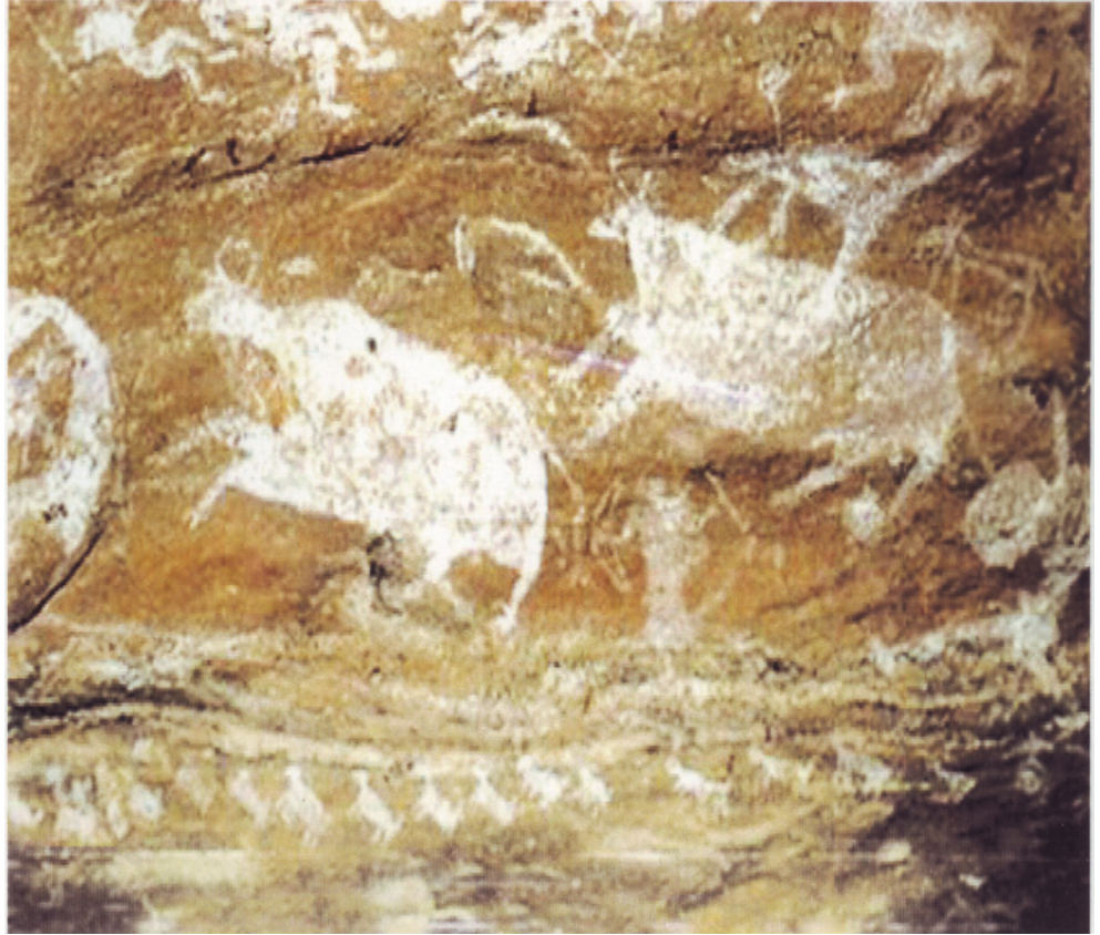
चित्र 1.2: 'गायों की कतारें', पंचमढ़ी

गायों की कतारें, इस स्थान पर पाए गए अनेक चित्रों में से एक है। इसमें एक ग्वाले को गायों को चराने हेतु ले जाते दर्शाया गया है। गायों की आकृतियों की शैली लगभग ज्यामितीय है। पृष्ठभूमि में गेरू (लाल) तथा आकृतियों के लिए सफेद रंग का प्रयोग किया गया है।