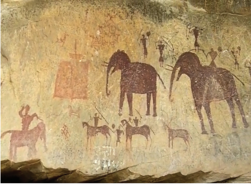
चित्र 1.1: 'आदिम शिकारी', मिर्जापुर

रंगों का प्रयोग बहुत ही सीमित है तथा उन आकृतियों को स्पष्टता देने हेतु प्रयोग किया गया है। कुछ चित्रों में लाल, काला और पीला रंग प्रयुक्त किया गया है। मानव आकृतियों की अपेक्षा पशु आकृतियाँ अधिक स्पष्टता से उभरी हैं।