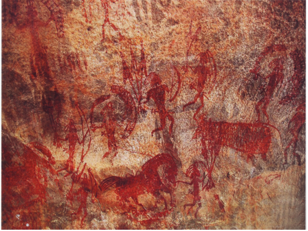
चित्र 1.3: 'योद्धा', भीमबेटका